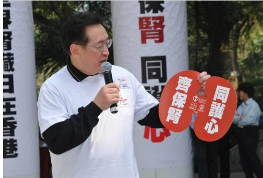
主禮嘉賓致辭 食物及衛生局局長周一嶽醫生