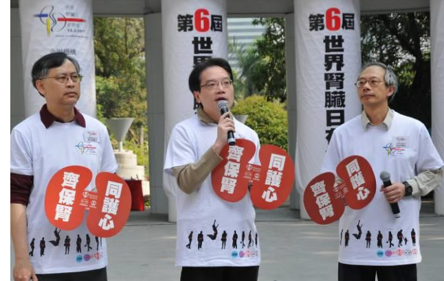
醫院管理局聯網服務總監張偉麟醫生