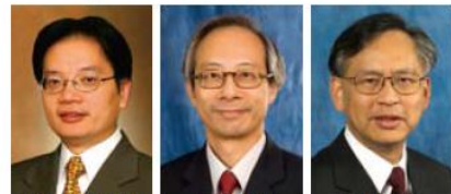
香港醫院管理局 聯網服務總監 張偉麟醫生 太平紳士 香港腎科 學會主席 梁誌邦醫生 香港腎臟 基金會主席 雷兆輝醫生

慢性腎臟疾病如果及早發現是可以治療的，從而減少其他併發症，以及減少死亡及由慢性腎病和心血管疾病引致的殘疾帶來全球性的負擔。值得注意，目前末期腎衰竭病人是可以得到腎臟代替治療。多年來，醫院管理局一直發展腎科服務並提供多種洗腎計劃，包括最新的家居自助血液透析、家居自動腹膜透析及與洗腎機構合作的社區血液透析計劃，透過更多的服務讓末期腎衰竭病人得到更好的治療及更好的復康生活。