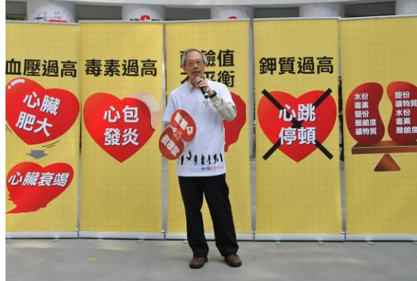
主辦代表致歡迎辭 香港腎科學會主席梁誌邦醫生